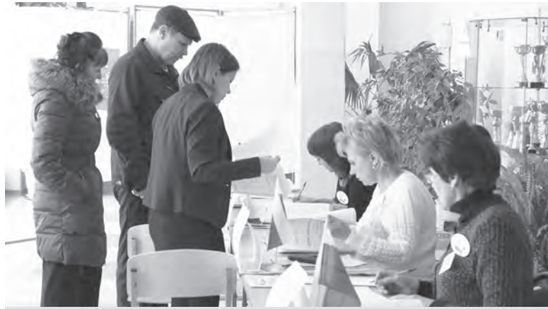
На трех избирательных участках в школе №27 проголосовало более 1530 каслинцев