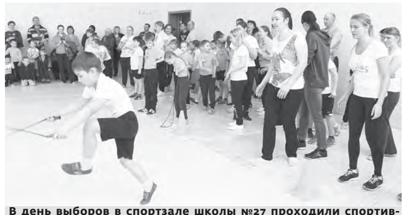
В день выборов в спортзале школы №27 проходили спортивные состязания «Мама, папа, я — спортивная семья» с участием учащихся младших классов и их родителей