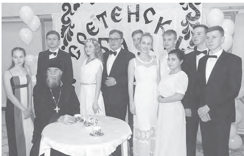
Протоиерей Георгий с организаторами бала