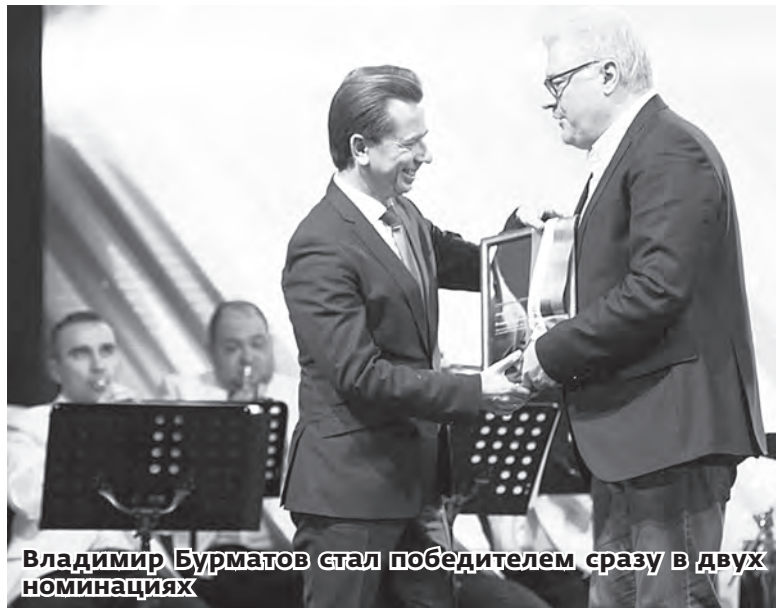
Владимир Бурматов стал победителем сразу в двух номинациях

«Владимир Бурматов попал в политический мейнстрим, он всегда находится в центре информационной повестки: не только региональной, но и федеральной, об этом говорит и его недавнее выступление на совещании у президента, когда от Госдумы выступали всего два человека — председатель Парламента и наш земляк Владимир Бурматов, который при