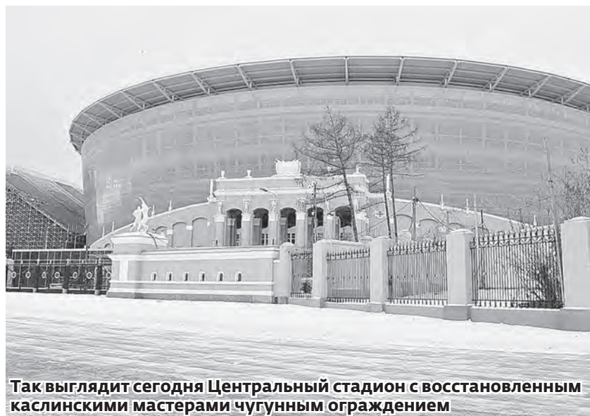
Так выглядит сегодня Центральный стадион с восстановленным каслинскими мастерами чугунным ограждением

Стадион построен в 1953–1957 гг. Он имеет статус объекта культурного наследия и включен в список памятников культуры государственного значения.