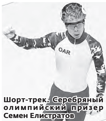
Шорт-трек. Серебряный олимпийский призер Семен Елистратов

димир Григорьев, Евгения Захарова, Денис Айрапетян, Артем Козлов (все – шорт-трек), Антон Шипулин, Евгений Гараничев, Екатерина Юрлова-Перхт, Максим Цветков, Ирина Услугина, Дарья Виролайнен, Алексей Волков (все – биатлон), Руслан Мурашов, Екатерина Шихова, Руслан Захаров, Анна Юракова, Алексей Есин, Юлия Скокова, Елизавета Казелина, Сергей Грязцов (все – конькобежный спорт), Сергей Устюгов, Глеб Ретивых (оба – лыжные гонки), Ксения Столбова,