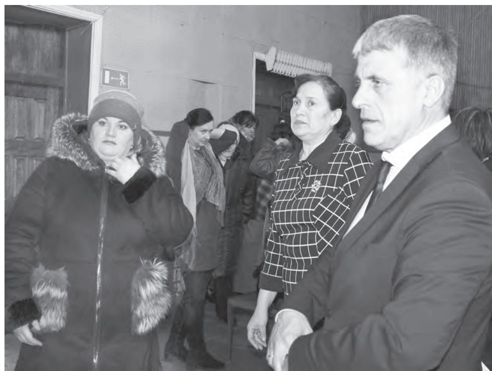
Диалог главы района с жителями Маука продолжился и после встречи

– Нет такой обязанности у родителей — содержать школу и ремонтировать ее, — подчеркнул он. – Если будут выявлены