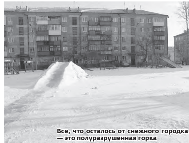
Все, что осталось от снежного городка – это полуразрушенная горка

Возможно, из-за того, что снежный городок так быстро оказался в неприглядном виде, его пришлось рано убрать. В один из недавних воскресных дней эта же бригада приехала и вывезла все, что осталось от ледовых и снежных конструкций. И