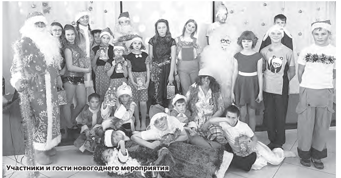
Участники и гости новогоднего мероприятия

Новый год – это ожидание чудес, чего-то волшебного и сказочного. У каждого ребенка, приглашенного на