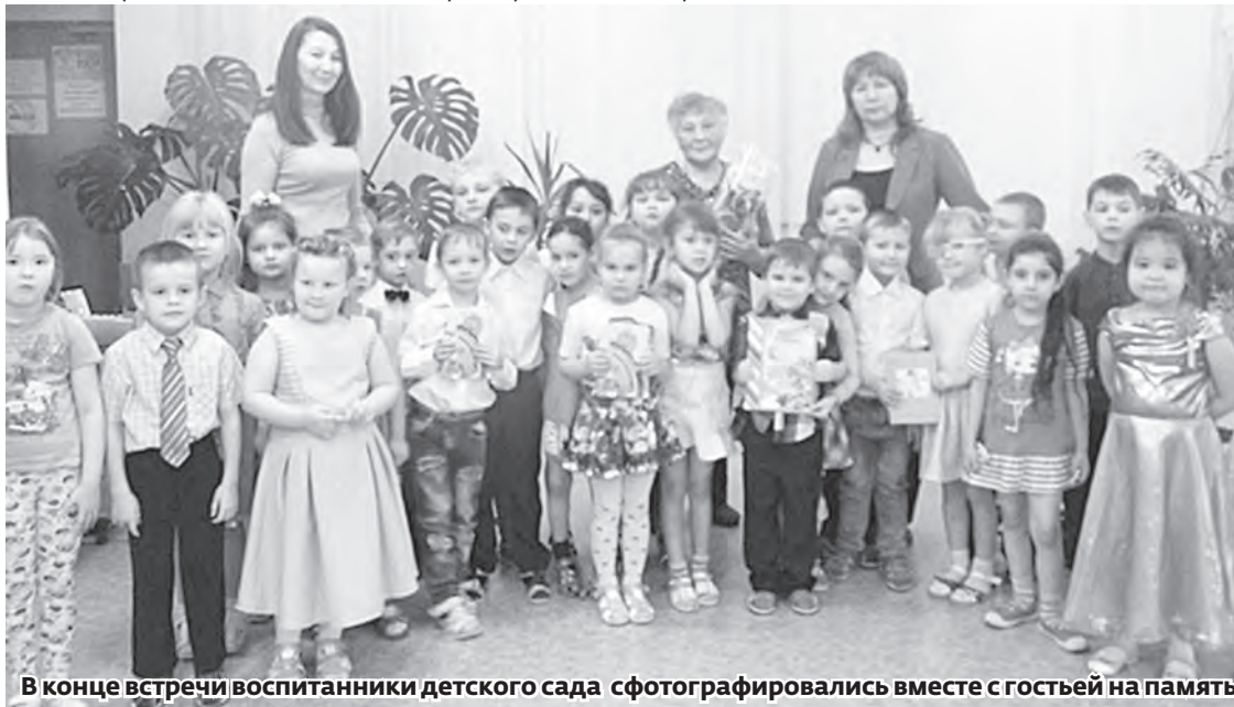
В конце встречи воспитанники детского сада сфотографировались вместе с гостьей на память