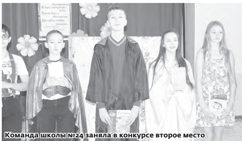
Команда школы №24 заняла в конкурсе второе место