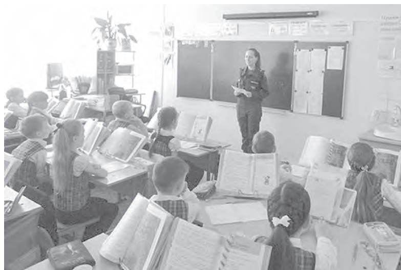
Инспектор проводит профилактическую беседу среди школьников

«На сегодняшний день сотрудниками Каслинского гарнизона пожарной охраны совместно с государственной инспекцией по маломерным судам проводятся профилактические мероприятия с учащимися образовательных учреждений. Приятно отметить, что школьники неплохо осведомлены о правилах поведения на льду и способах спасения про-