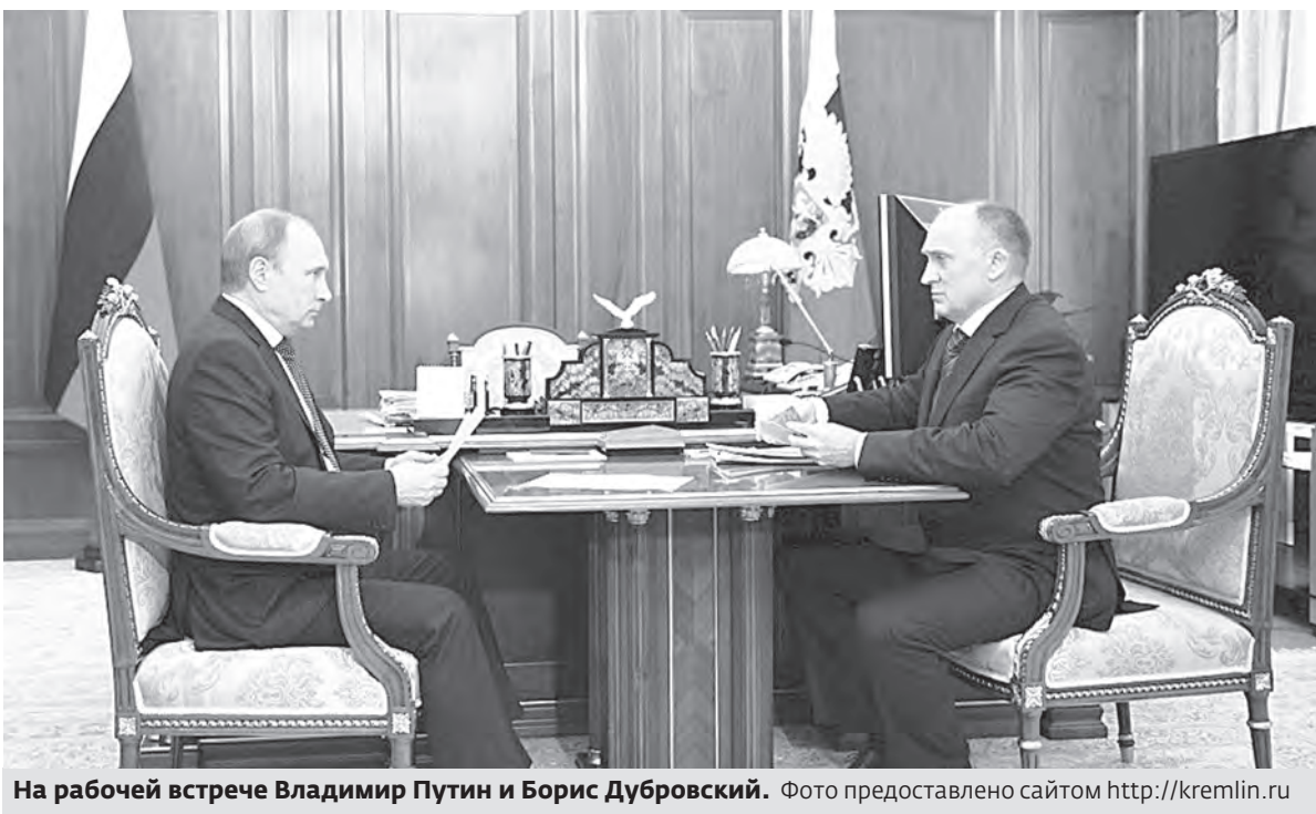
На рабочей встрече Владимир Путин и Борис Дубровский.

Президент России Владимир Путин провёл рабочую встречу с губернатором Челябинской области Борисом Дубровским. Губернатор доложил главе государства о финансово-экономической ситуации в регионе.