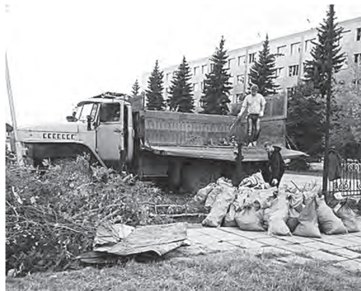
Участники субботника вывозят мусор с территории парковой зоны машзавода