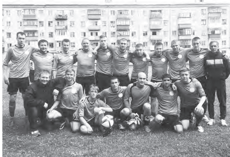
Дома и поле помогает. Сборная футболистов Каслинского муниципального района