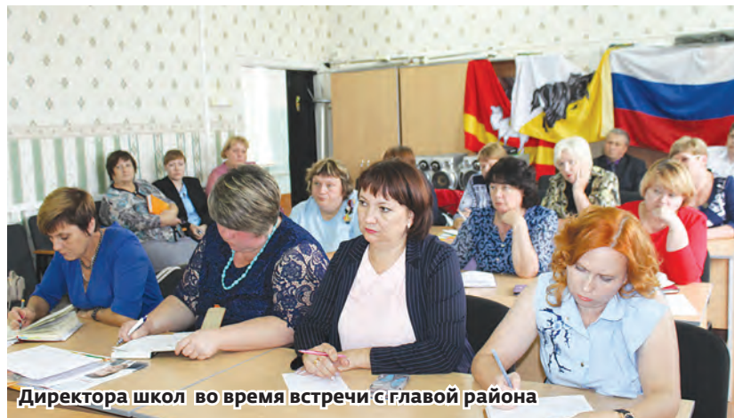
Директора школ во время встречи с главой района