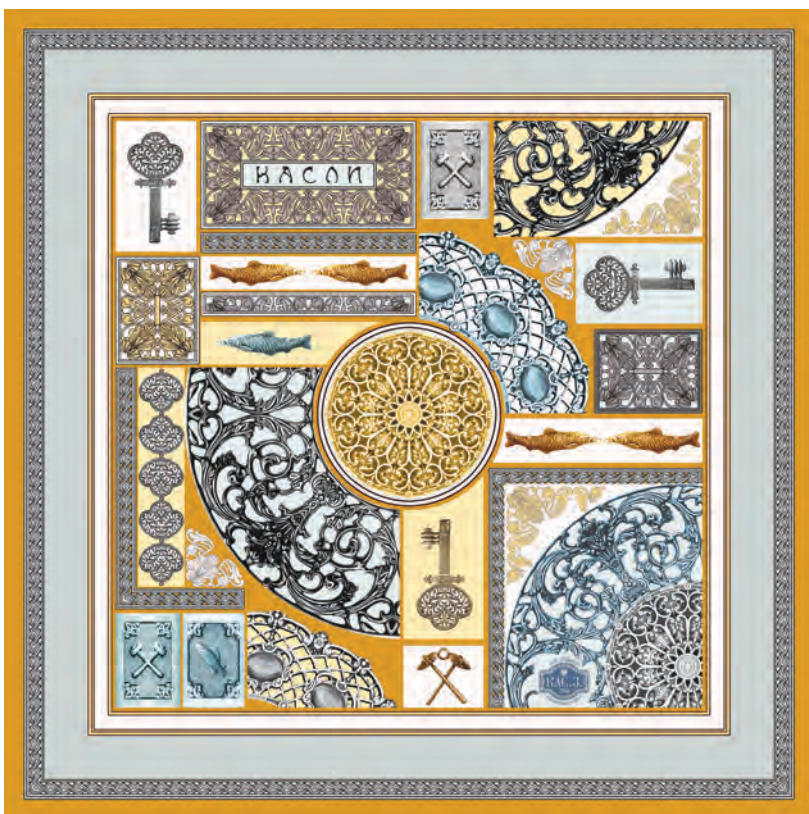
Каслинский шелковый платок

В первом использованы мотивы и торжественная красно-черно-золотая гамма знаменитого Каслинского чугунного павильона, получившего в 1900