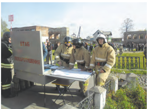
Штаб пожаротушения ФГКУ «8 ОФПС по Челябинской области»

Личным составом 8-го отряда федеральной противопожарной службы были отработаны вопросы взаимодействия администрации объекта с пожарно-спасательными подразделениями при проведении аварийно-спасательных работ и тушении пожара, взаимодействие со службами жизнеобеспечения по оказанию помощи, проверка готовности сил и средств подразделения по тушению условного пожара в технологическом производстве, с отработкой эвакуации персонала.