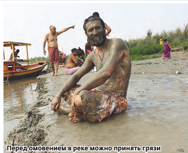
Перед омовением в реке можно принять грязи

Всю Индию можно считать местом силы. Но есть в ней такие места, где хочется становиться лучше, чище, мудрее, хочется размышлять о жизни и о