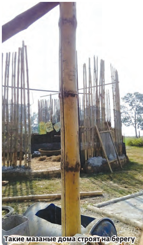
Такие мазаные дома строят на берегу