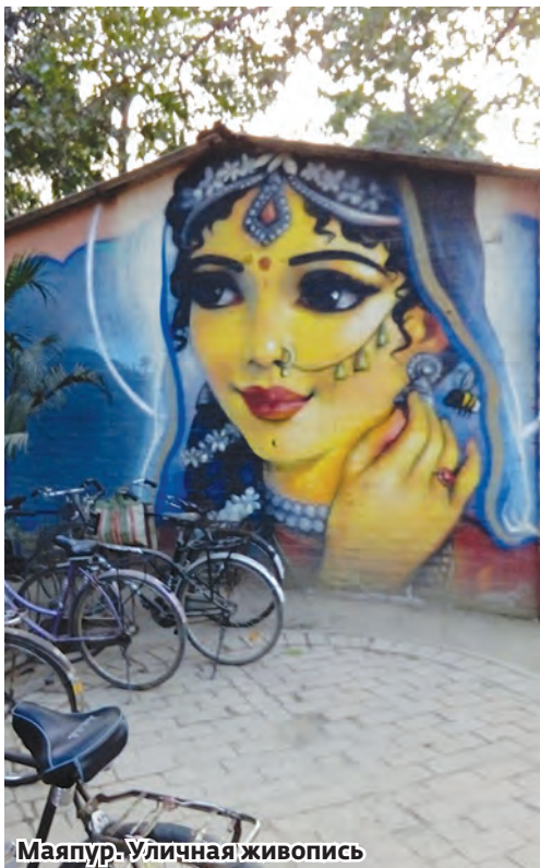
Маяпур. Уличная живопись