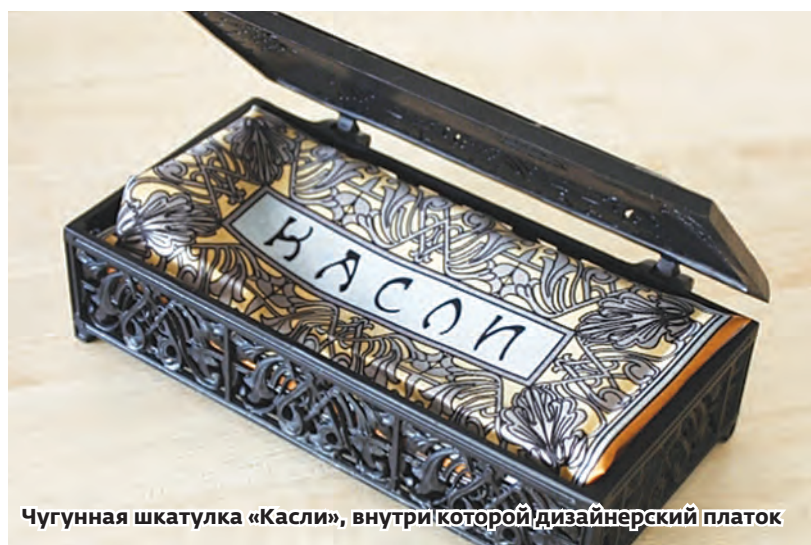
Чугунная шкатулка «Касли», внутри которой дизайнерский платок