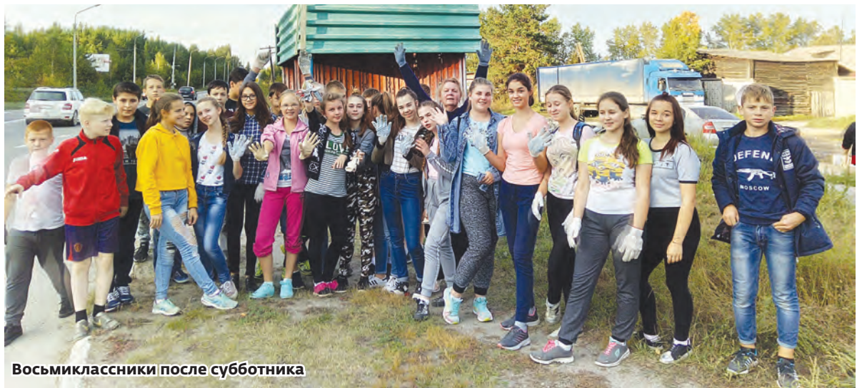
Восьмиклассники после субботника

вокруг въездного знака периодически убирают, но, к сожалению, чаще всего, первое, что видят приезжие, — сплошь увешанный выцветшими и засохшими букетами цветов силуэт коня, битое стекло, пластиковые стаканы, окурки, которые оставляют после себя молодожены, приезжающие сюда, чтобы отдать дань традициям. Да и проезжающие