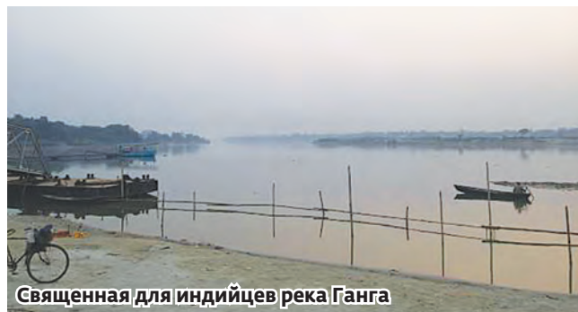
Священная для индийцев река Ганга