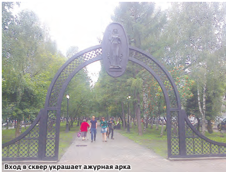
Вход в сквер украшает ажурная арка

чи полна душевного тепла и обаяния, но при этом образ шахтера наполнен героическим пафосом и внутренней значимостью.