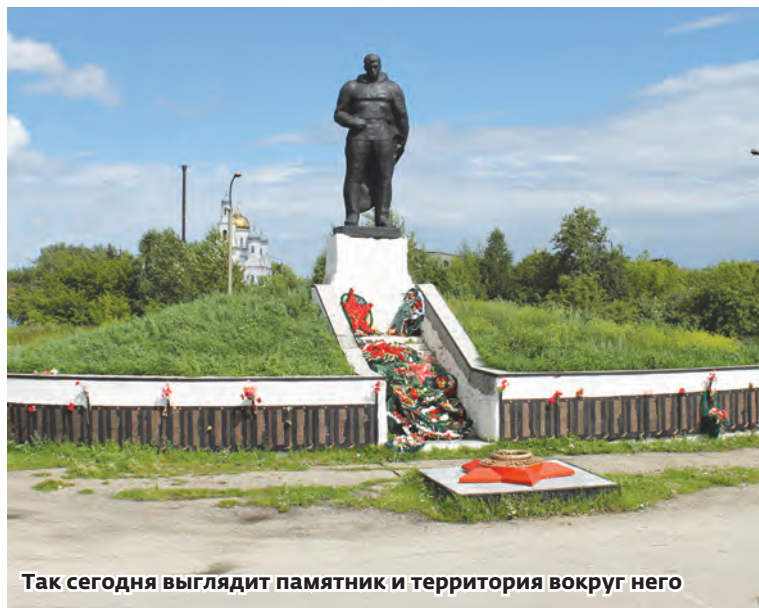
Так сегодня выглядит памятник и территория вокруг него

Сегодня многие жители города считают, что памятник не только нуждается в реставрации, его необходимо перенести в более подходящее место. Как бы там ни было, но вряд ли в ближайшие десятилетия наш монумент сменит свое привычное для горожан местоположение, поэтому, раз уже появилась такая уникальная возможность, необходимо