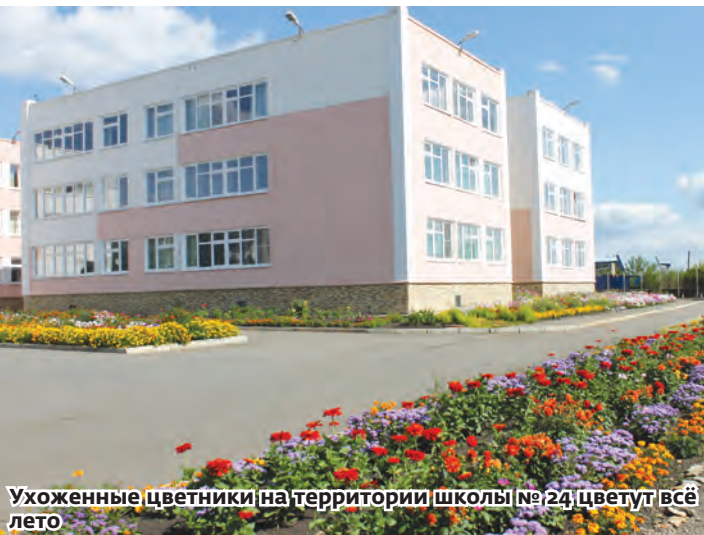
Ухоженные цветники на территории школы №24 цветут всё лето

Как организации благоустраивают прилегающие территории