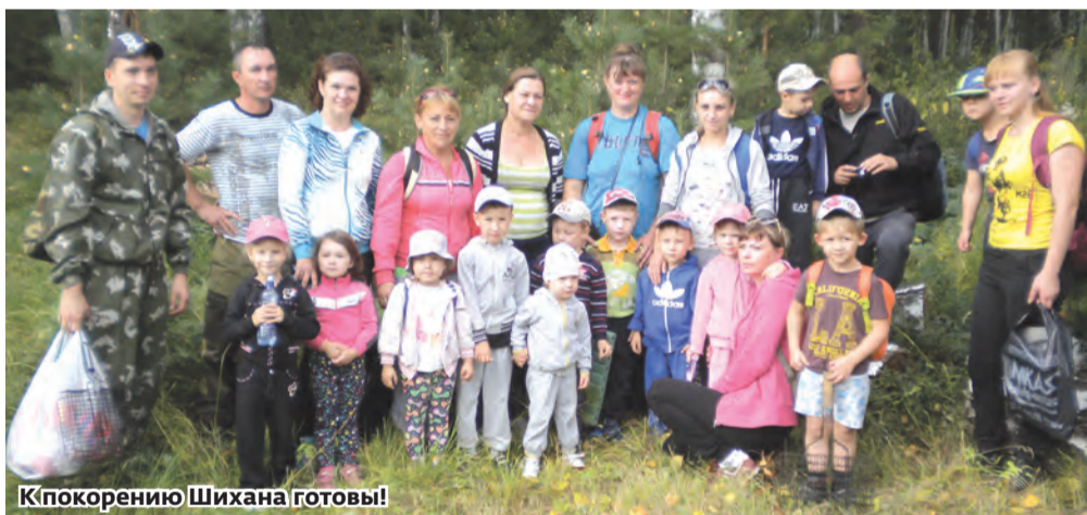
К покорению Шихана готовы!

Уже пятый год по традиции в теплый августовский день дошколята со своими родителями и воспитателями детского сада № 1 «Колобок» покоряют гранитный скальный массив Южного Урала – Аракульские Шиханы.