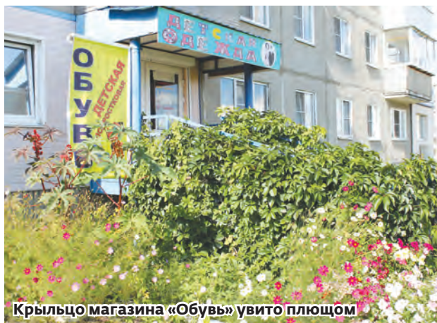
Крыльцо магазина «Обувь» увито плющом