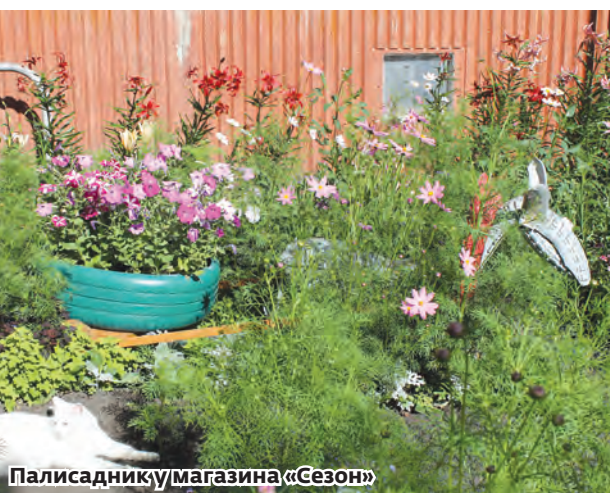
Палисаднику магазина «Сезон»