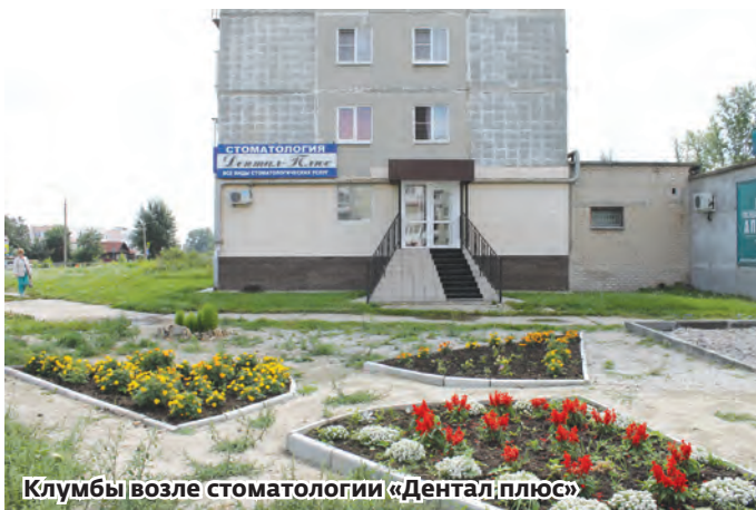
Клумбы возле стоматологии «Дентал плюс»

Как организации благоустраивают прилегающие территории