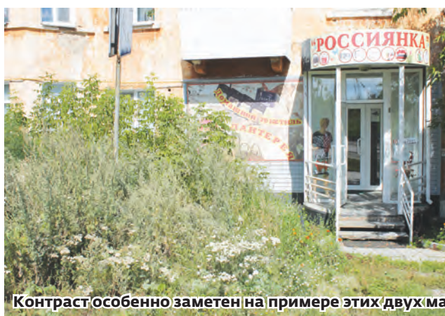
Контраст особенно заметен на примере этих двух магазинов, соседствующих в одном доме