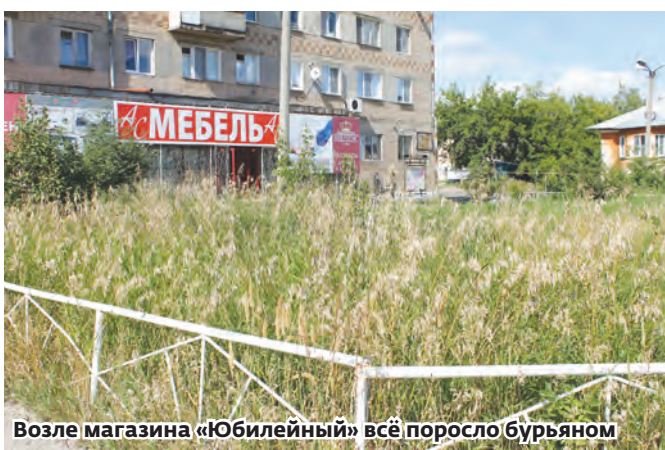
Возле магазина «Юбилейный» всё поросло бурьяном