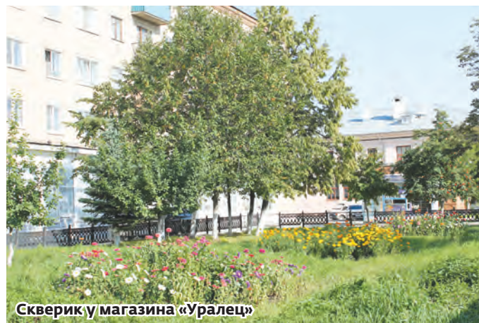
Скверик у магазина «Уралец»