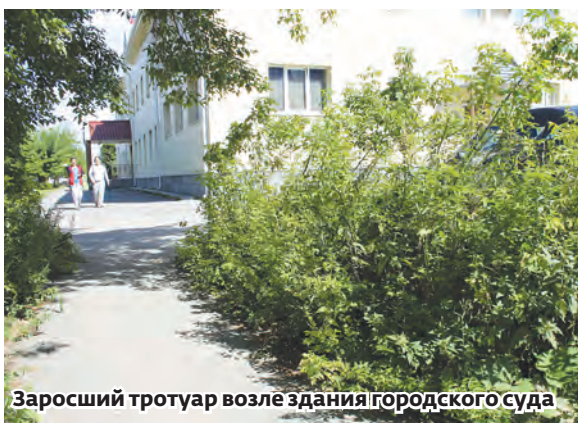
Заросший тротуар возле здания городского суда