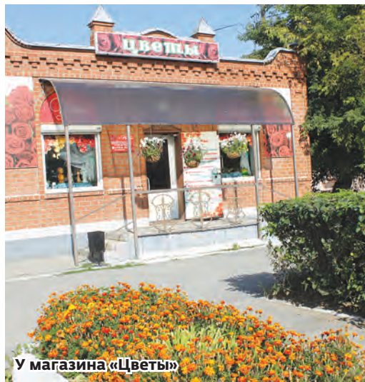
У магазина «Цветы»

Наверное, если спросить любого каслинца, любит ли он свой город, то каждый ответит «да», и многие ни за что не променяют Касли ни на какое другое место на земле. Но любить тоже можно по-разному. Кто-то живёт, переставая замечать неухоженность и беспорядок вокруг — заросшие бурьяном участки, стихийные свалки, а кто-то старается сделать родной город чище и красивее, и делает это не по принуждению, а по собственной инициативе, и не для кого-нибудь, а для себя.