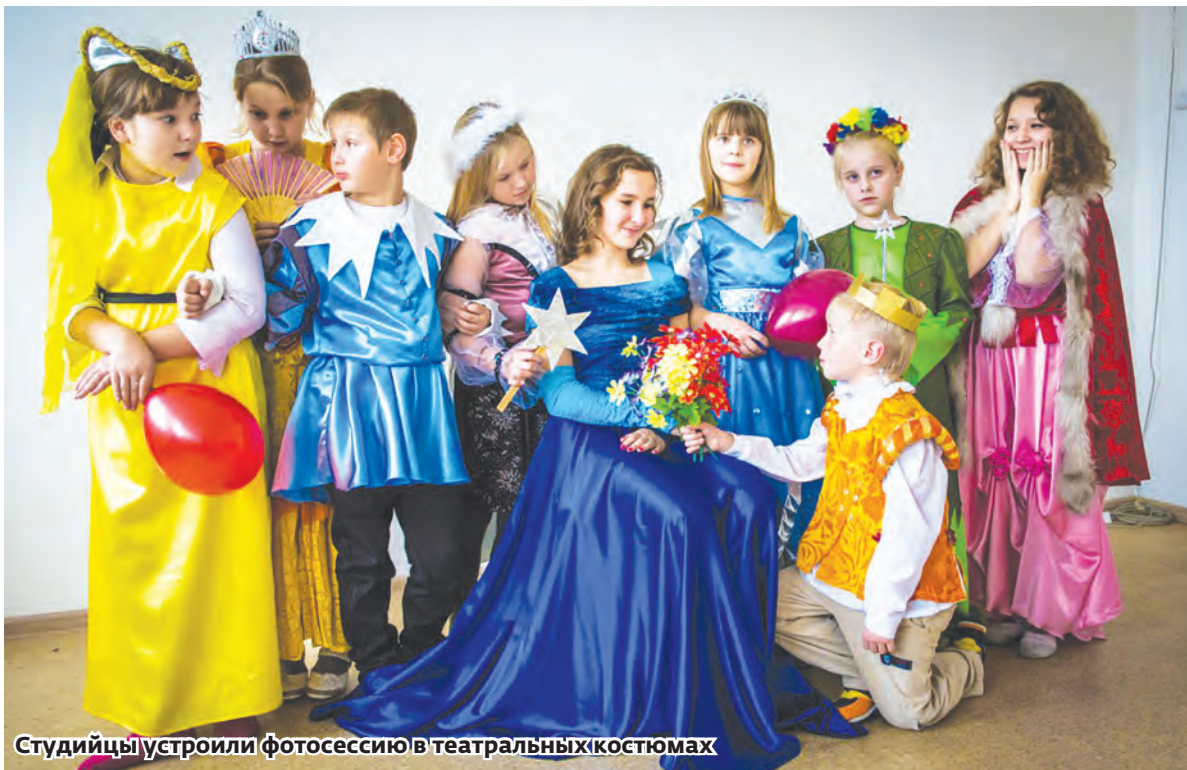
Студийцы устроили фотосессию в театральных костюмах