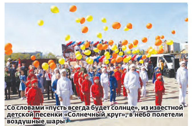
Со словами «пусть всегда будет солнце», из известной детской песенки «Солнечный круг», в небо полетели воздушные шары