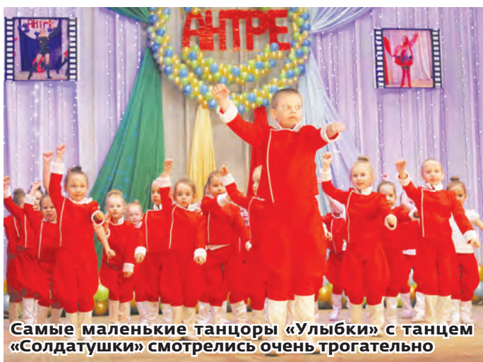
Самые маленькие танцоры «Улыбки» с танцем «Солдатушки» смотрелись очень трогательно