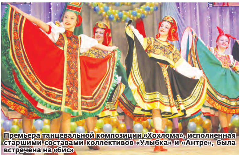
Премьера танцевальной композиции «Хохлома», исполненная старшими составами коллективов «Улыбка» и «Антре», была встречена на «бис»

Ежегодный отчетный концерт образцового хореографического коллектива «Антре» прошёл при полном аншлаге 22 апреля. Практически за неделю до его начала почти все билеты были разобраны.