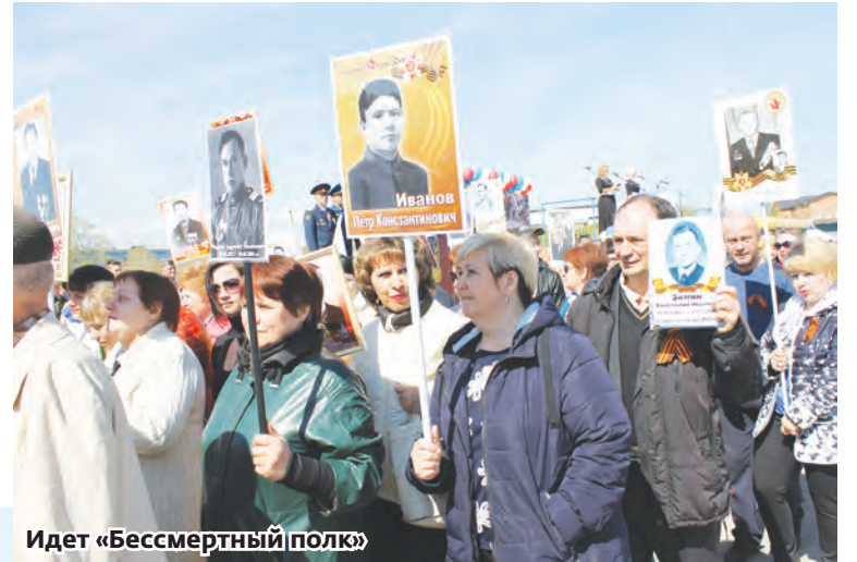
Идет «Бессмертный полк»