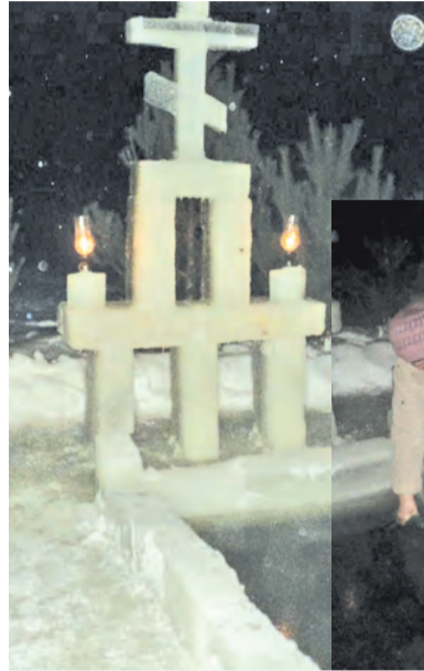
Жители набирают воду из купели

В морозную ночь жители села набирали святую воду,