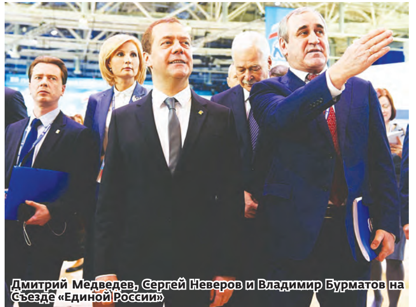
Дмитрий Медведев, Сергей Неверов и Владимир Бурматов на Съезде «Единой России»

«Мы с Владимиром Владимировичем уже давно плодотворно работаем в Челябинской области в плане отстаивания интересов малого и среднего бизнеса, законодательной деятельности. Как один из примеров, это закон о торговле, в работе над которым Владимир Бурматов принимал активное участие, встречался с федеральными министрами. Сегодня мы с ним занимаемся реформированием региональных, муниципальных контрольно-надзорных органов, и, конечно, его опыт, знания, возможности позволят создать привлекательный инвестиционный климат в Челя-