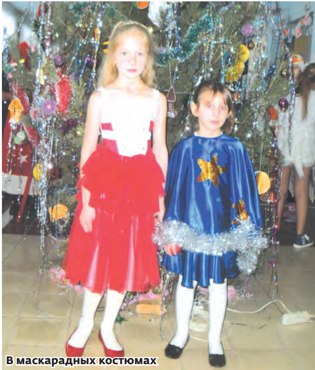
В маскарадных костюмах