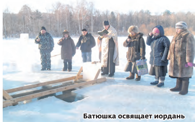
Батюшка освящает иордань