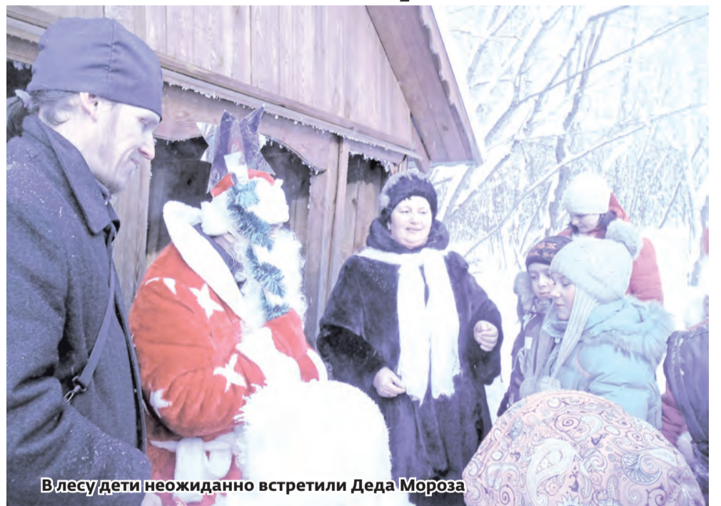
В лесу дети неожиданно встретили Деда Мороза

селка организовала в этом году не только праздничную ёлку на площади, большая длинная ледяная горка с поворотами радует ребятшек и взрослых. А возле ёлки целый ансамбль ледяных скульптур, в изготовлении которых участво-