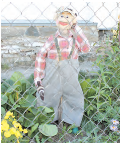
Вот такая парочка поселилась на лето в палисаднике по ул. Декабристов