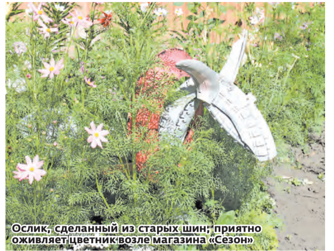
Ослик, сделанный из старых шин; приятно оживляет цветник возле магазина «Сезон»

Всегда приятно слышать, как взрослые в этой семье общаются с детьми – не сюсюкаются, разговаривают на равных, спокойно,