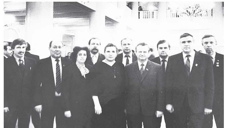
Делегация Каслинского района на областной партийной конференции. г. Челябинск