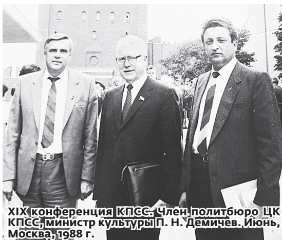
XIX конференция КПСС. Член политбюро ЦК КПСС, министр культуры П. Н. Демичев. Июнь, Москва, 1988 г.