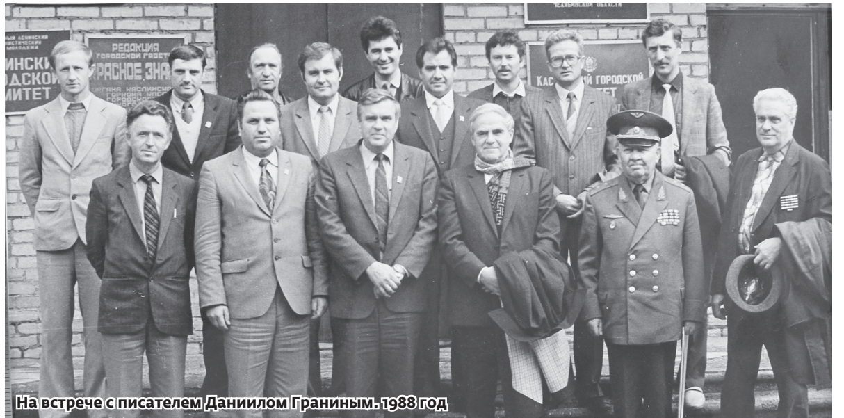
На встрече с писателем Даниилом Граниным. 1988 год