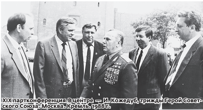
XIX партконференция. В центре — И. Кожедуб, трижды Герой Советского Союза. Москва. Кремль. 1988 г.