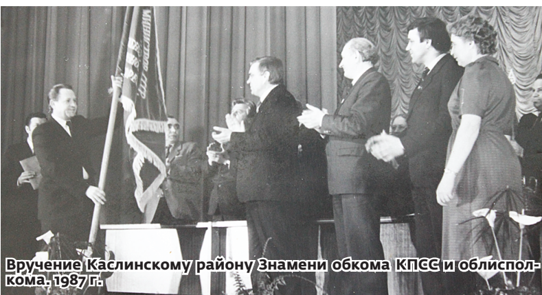
Вручение Каслинскому району Знамени обкома КПСС и облисполкома. 1987 г.