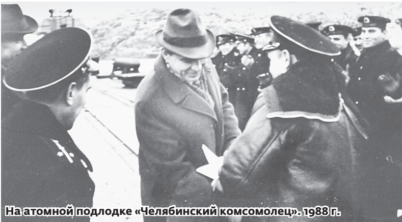
На атомной подлодке «Челябинский комсомолец». 1988 г.