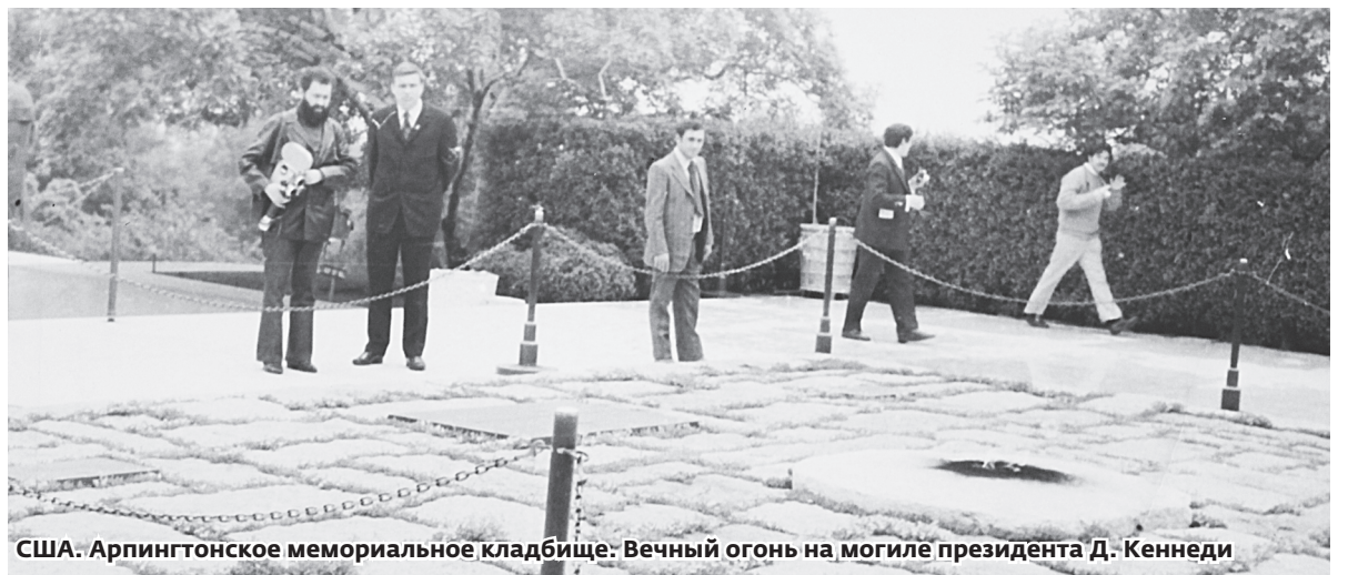
США. Арлингтонское мемориальное кладбище. Вечный огонь на могиле президента Д. Кеннеди