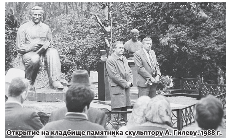
Открытие на кладбище памятника скульптору А. Гилеву. 1988 г.