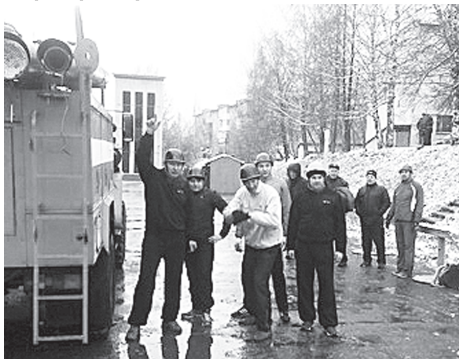
Команда Каслинского гарнизона готовится к старту

Программа соревнований включала в себя выполнение трёх упражнений. Это подъём по штурмовой лестнице в окно четвёртого этажа учебной башни, три результата из четырёх были приняты в зачёт. Во время выполнения установки и подъёма по трёхколенной лестнице в окно четвёртого этажа сотрудники